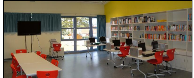
Mediothek mit Bibliothek und Leseecke