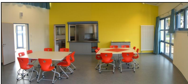
Bistrobereich mit Ausgabeküche