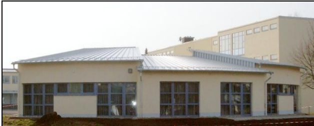
neues separates Ganztagsschulgebäude

Seit Januar 2008 steht den Schülerinnen und Schülern, die das Angebot der freiwilligen Ganztagschule in Anspruch nehmen, sowie ihren Betreuern und Lehrern ein modernes, eigenständiges Gebäude zur Verfügung. Dieses Gebäude verfügt über eine Küche, ein Bistro, eine Mediothek mit Bücherecke, ein Ruheraum und ein Raum für Hausaufgabenbetreuung.