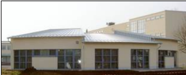
neues separates Ganztagsschulgebäude

Seit Januar 2008 steht den Schülerinnen und Schülern, die das Angebot der freiwilligen Ganztagsschule in Anspruch nehmen, sowie ihren Betreuern und Lehrern ein modernes, eigenständiges Gebäude zur Verfügung. Dieses Gebäude verfügt über eine Küche, ein Bistro, eine Mediothek mit Bücherecke, ein Ruheraum und ein Raum für Hausaufgabenbetreuung.