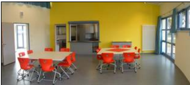
Bistrobereich mit Ausgabeküche