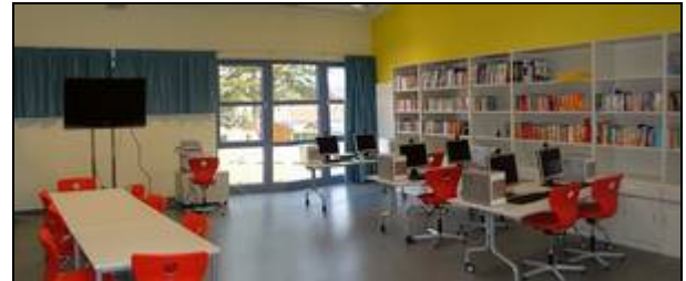
Mediothek mit Bibliothek und Leseecke